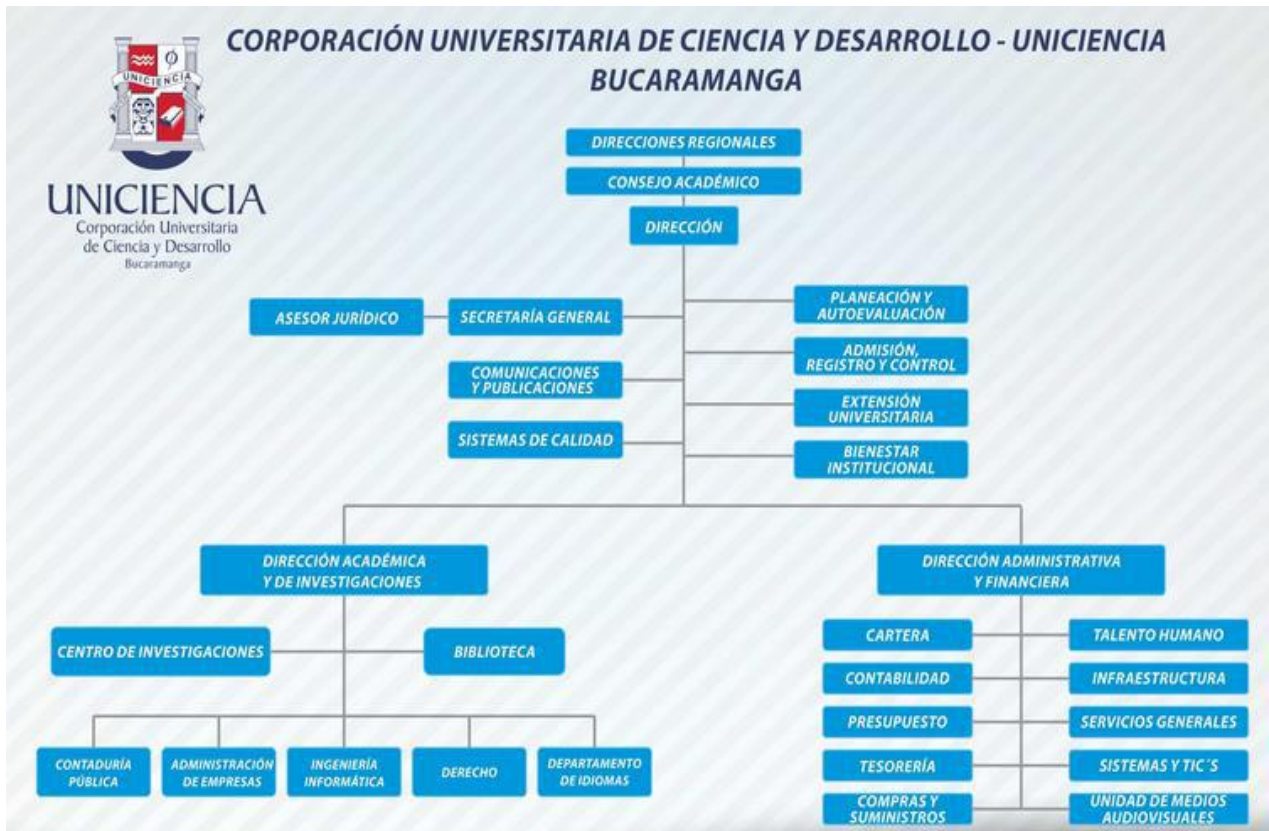
Grafico 03. Estructura Organizacional UNICIENCIA Bucaramanga